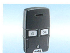
Fjernbetjening EasyStart R