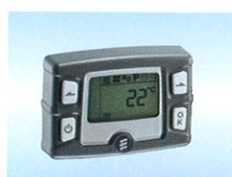
Kontaktur EasyStart T