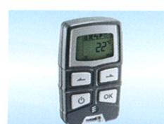
Fjernbetjening EasyStart R+