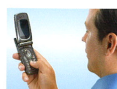
Telefon- fjernbetjening ① CALLTRONIC